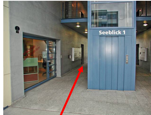
Eingang in der Mitte des Gebäudes (Passage)