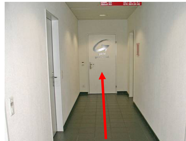
Am Ende des Ganges finden Sie get it!