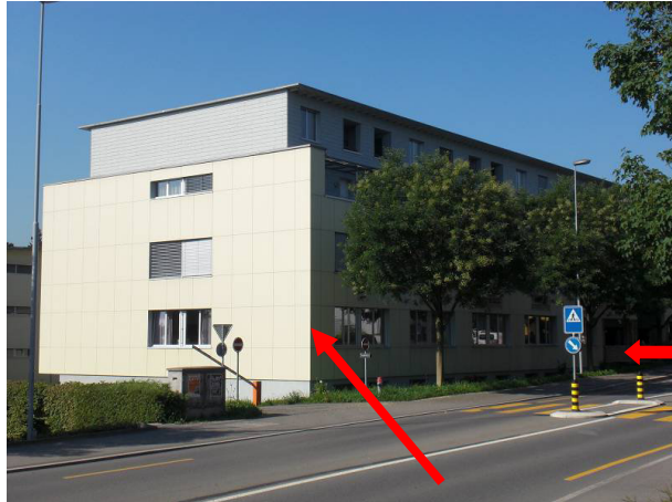
Von Zug her kommend, linke Strassenseite